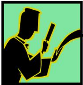
Avocat ou défenseur du salarié