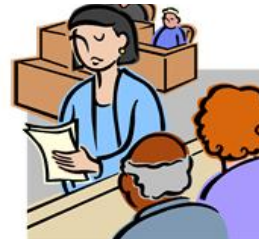
Juriste de la Caisse