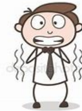
Salarié dont on examine l'affaire