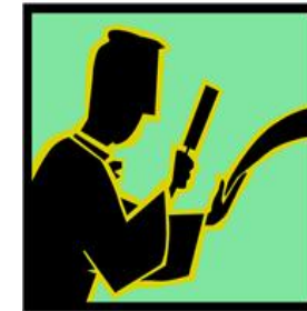
Avocat de l'employeur en cas FIE