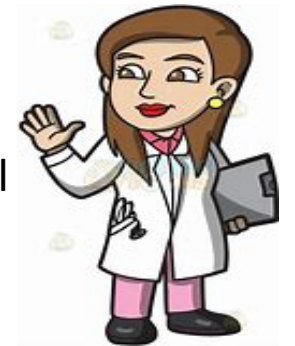
Médecin conseil sécurité sociale