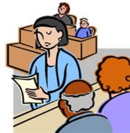
Juriste de la Caisse