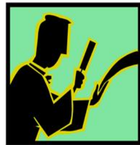
Avocat du salarié