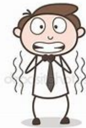
Assuré dont on examine l'affaire